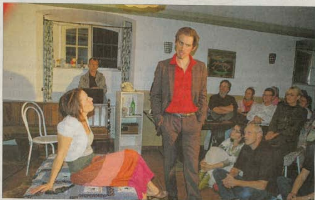
Szenenwechsel: Publikum, Darsteller und Bühnentechnik improvisierten in der engen Gaststube.

Im September wird die Komödie von Dario Fo noch fünfmal in Neuenkirchen aufgeführt. (Termine am 18./19./24./25./26. 9). Dann ist sie aber auf jeden Fall im Trockenen – im Dorfgemeinschaftshaus – zu genießen.